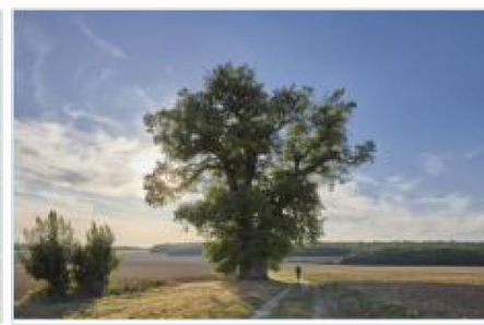
PRIX COUP DE CŒUR LA FORESTIÈRE

Centre-Val de Loire, Meung-sur-Loire (Loiret)