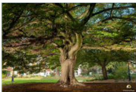
PRIX DU JURY