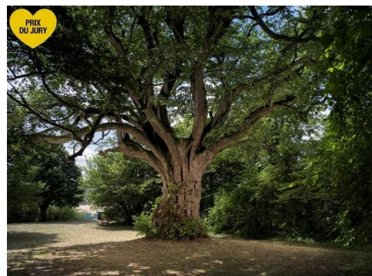
Tilleul de la colline Sainte-Hélène